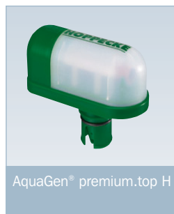
AquaGen® premium.top H

Der AquaGen® premium.top-Rekombinator wird als externes Bauteil auf der Batterie installiert. Dadurch wird ein Temperaturanstieg in der Batterie ausgeschlossen. Die Trennung der Rekombination von den aktiven Bauteilen der Batterie ermöglicht die Reduzierung des Wartungsaufwandes analog zu verschlossenen Batterien, ohne Reduzierung der Gebrauchsdauererwartung und ohne Einschränkung der Betriebsbedingungen.