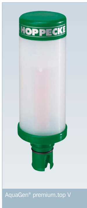
AquaGen® premium.top V

Durch diese Effizienz wird der Aufwand für das Nachfüllen von Wasser drastisch reduziert, bis hin zur Wartungsfreiheit.